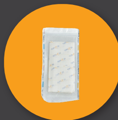
30*40 см драпировка