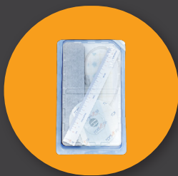
Набор повязок для резанных ран 4,5*22 см повязка из губчатого материала 1 шт. трекпад 1 шт. 30х40 см драпировка 1 шт. линейка