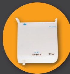
Канистра объемом 75 см 3