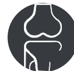
Ортопедические и хирургические раны

Применяется врачами после операций для ускорения заживления раны, снижения риска появления внутрибольничных инфекций, предотвращения инфицирования раны и ее рубцевания.