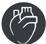
Раны после кардио-торакальных и сосудистых хирургических операций