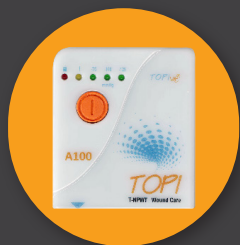
Устройство для вакуумной терапии ран ТОРІ А100 Классик ЛРОД