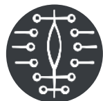
Акушерские и гинекологические раны