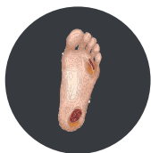
Раны при диабетической стопе