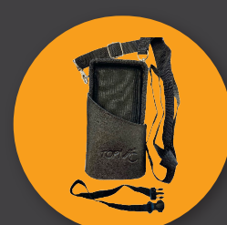
Сумка для транспортировки устройства