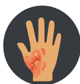
Раны после ожогов