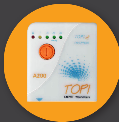
ТОРІ А200 для резанных ран ЛРОД Устройство для вакуумной терапии ран