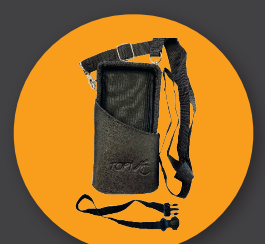
Sac de Transport pour Appareil