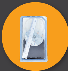
Ensemble de Mousse de Pansement Classique mousse de pansement 10*10 cm Pavé Tactile 1 Pièces 1 Pièce de drap 30x40 cm 1 Règle de Pcs