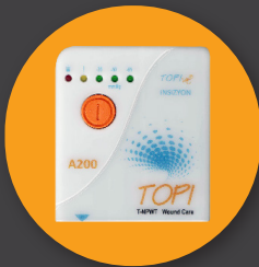
TOPI A200 Incision NPWT Assisté par le Vide Thérapie de Soins Des Plaies Appareil