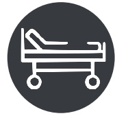
Douleur de Pression / Lit