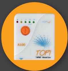
TOPI A100 Classique TPN Plaie Assistée Par Vide Appareil de Thérapie de Soins