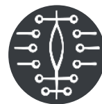
Plaies Chirurgicales Obstétricales et Gynécologiques