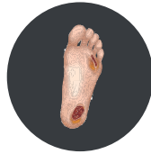
Plaie du Pied Diabétique Plaie Chronique