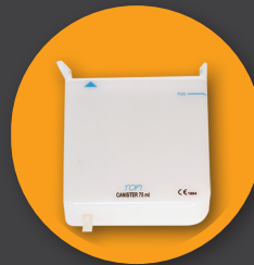
Bidon de 75 cc