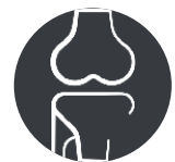
Plaies Chirurgicales Orthopédiques

Utilisé par les médecins après la chirurgie pour réduire le risque d'infection à l'hôpital, pour empêcher la plaie de s'infecter, pour guérir la plaie rapidement et pour prévenir les cicatrices.